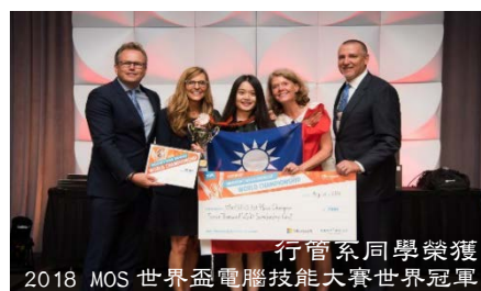
行管系同學榮獲 2018 MOS 世界盃電腦技能大賽世界冠軍