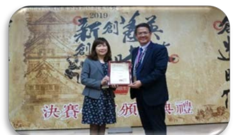
本校榮獲 2019 第十四屆戰國策全國創新創業競賽 創育機構推動獎