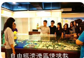
自由經濟港區情境教