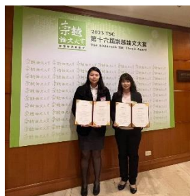
崇越論文大賞-佳作