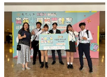
2024 第 4 屆青年老闆 築夢計畫-佳作