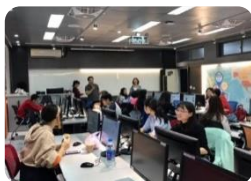
商貿智慧虛擬 互動中心