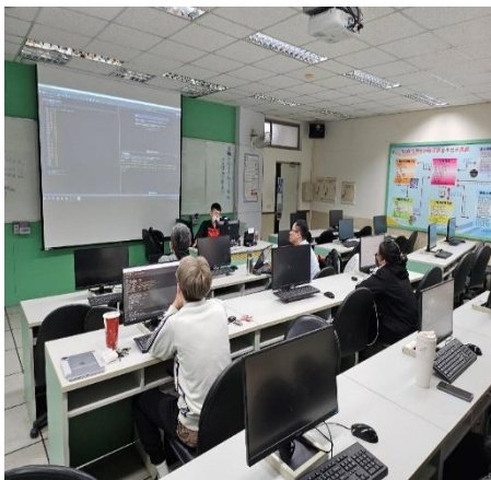
行銷與流通 科技整合應用專業教室