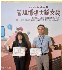
富邦博碩士論文-佳作