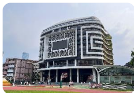
誠信館-全新落成 多功能智慧教學大樓