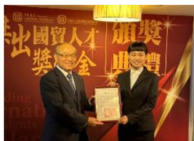
國貿系學生榮獲「傑出國貿人才獎學金」