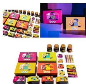
多設系學生榮獲「2024 德國紅點品牌暨傳達設計競賽」紅點獎 (Red Dot Award)