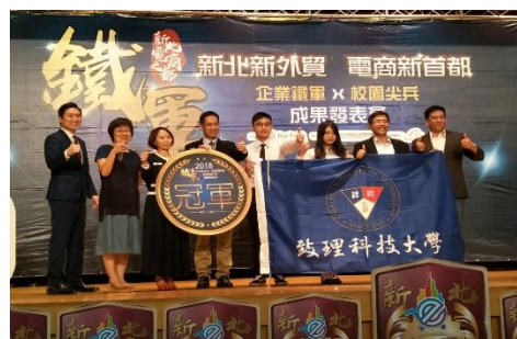
新北鐵軍培訓營(電商競賽)冠軍