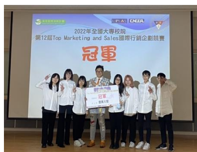
第 12 屆國際行銷企劃競賽冠軍