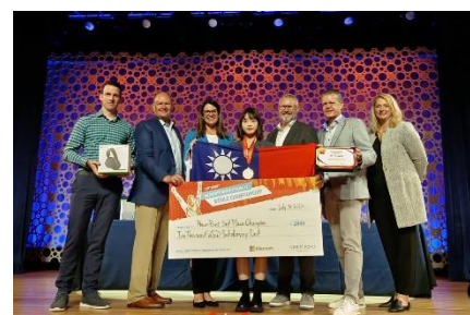
行管系學生榮獲「2024 MOS 全球總決賽」全球第三名