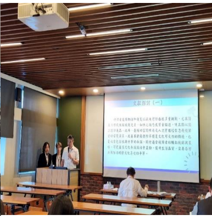
創新商業模式實驗室