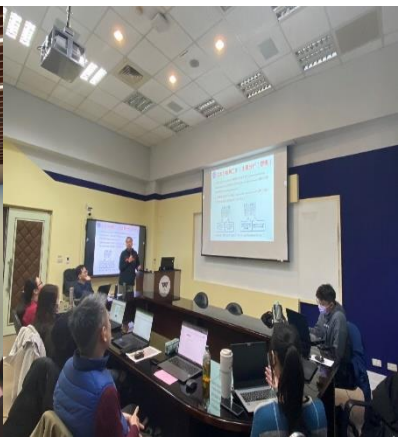
智慧商務虛實整合實驗室