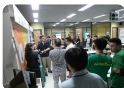
O2O 營運實驗室 系統操作示範