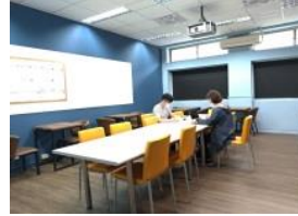
指導老師細心指導