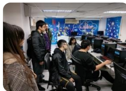
人工智慧與數位 創新實驗室