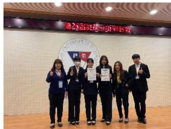
決策分析研討會- 最佳論文獎