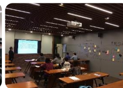
創新商業模式 實驗室