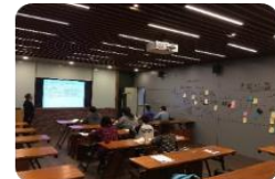
創新商業模式 實驗室