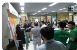
O2O營運實驗室 系統操作示範