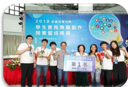
商管系學生參加 2019 全國技專校院學生 實務專題製作競賽暨成果展 榮獲第一名