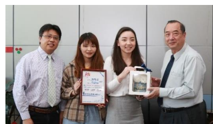
109 教育部 U-START 計畫獲獎