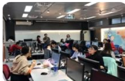
商貿資訊整合中心