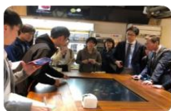
未來超市智慧餐桌- 日本弘國大學師生參訪