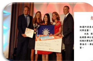
行管系學生參加 2018MOS/ACA 世界盃大賽 榮獲世界冠軍