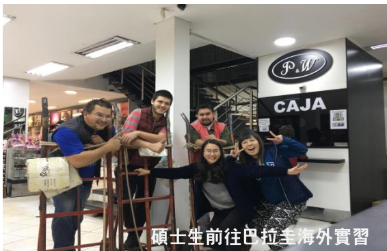
碩士生前往巴拉圭海外實習