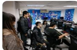
人工智慧與數位創 新實驗室