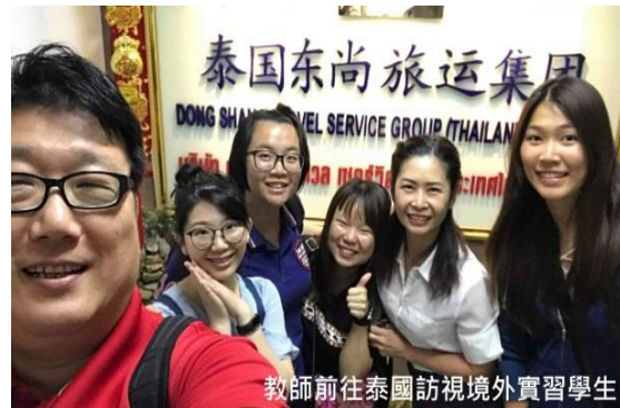
教師前往泰國訪視境外實習學生