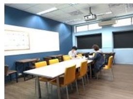
指導老師細心指導