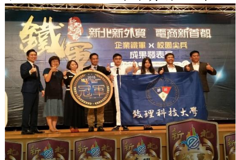
新北鐵軍培訓營(電商競賽)冠軍